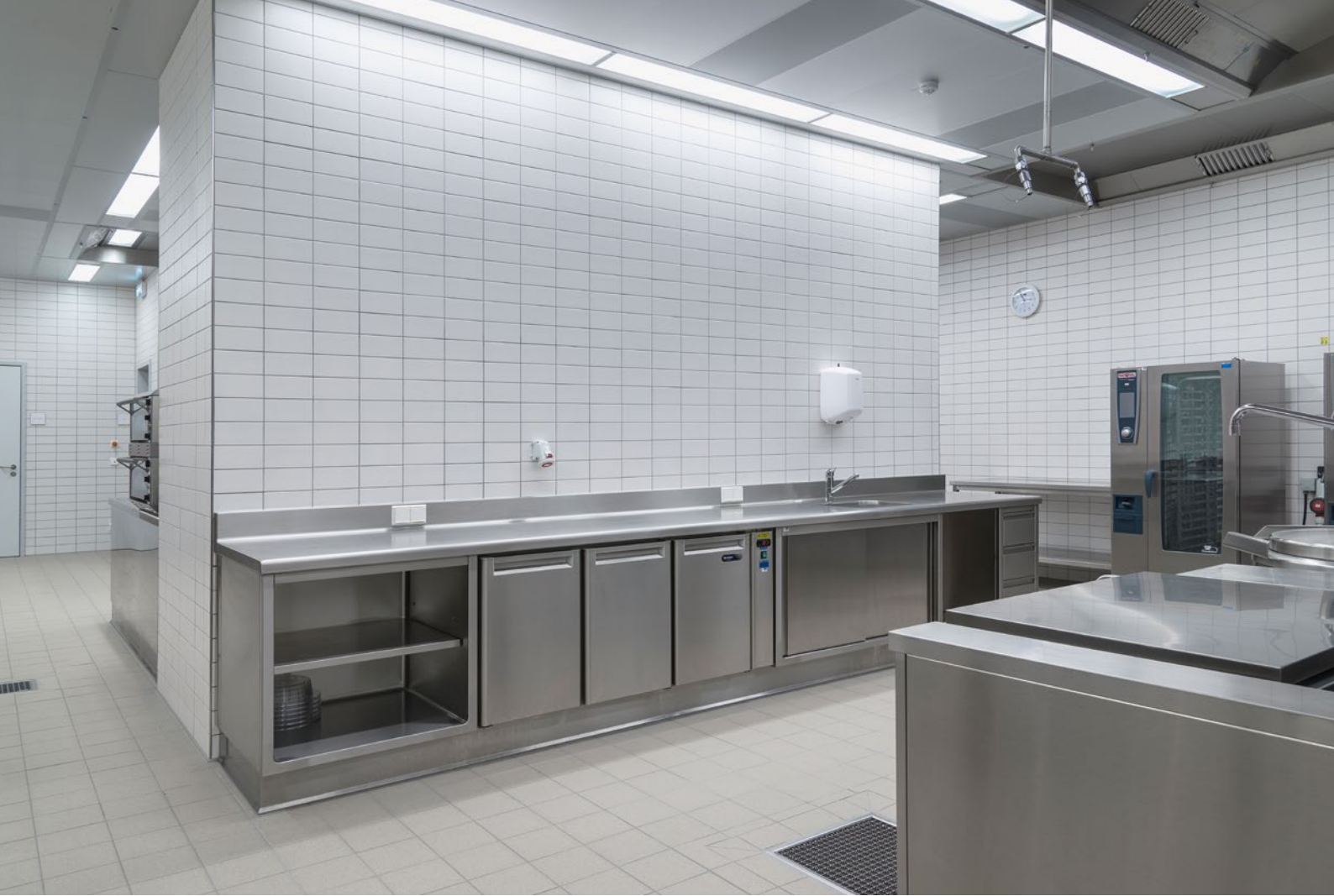
Lënster Lycée in Junglinster, Luxembourg, G+P Muller Architectes