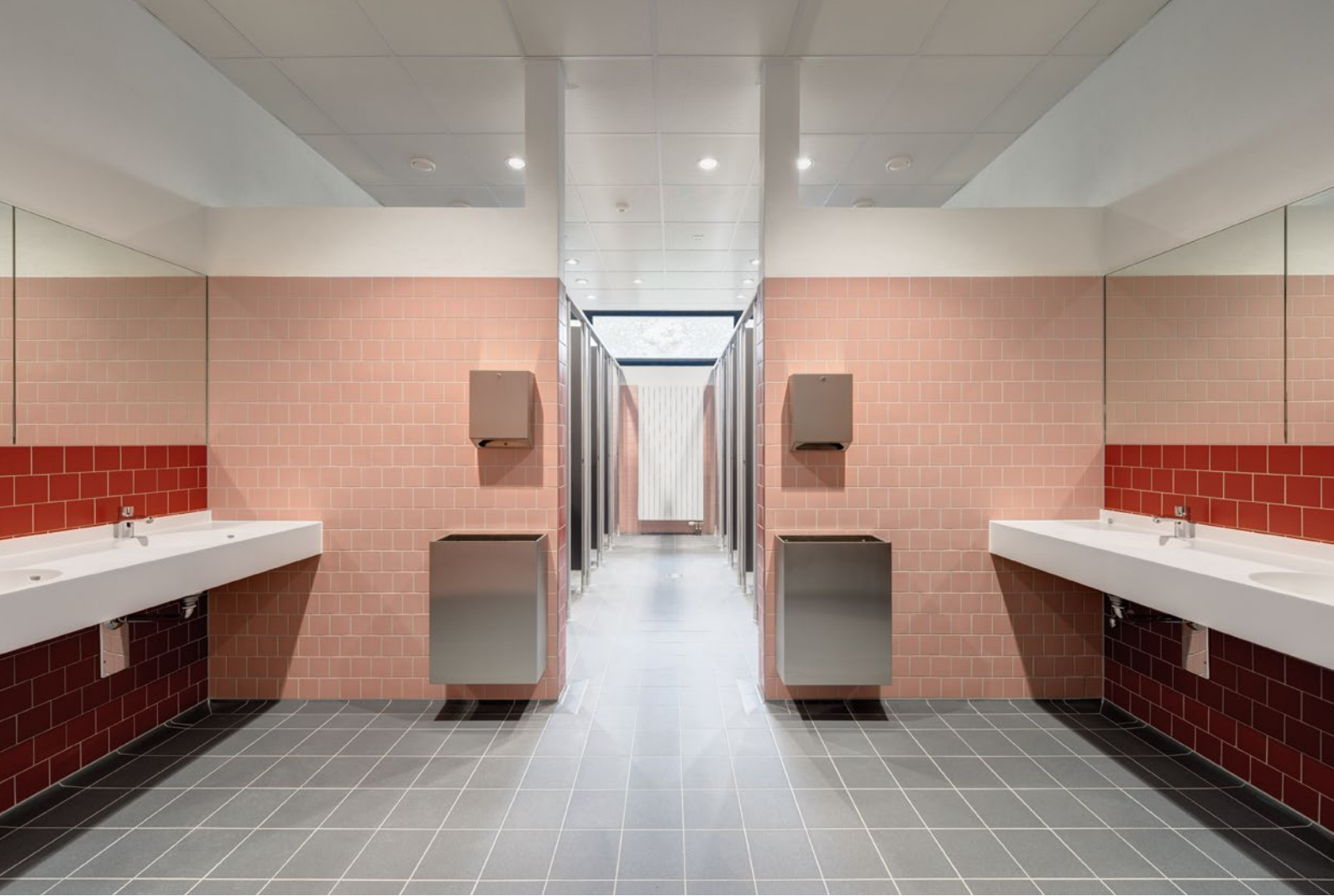
Schulzentrum Köln Zündorf, spies architekten, Köln