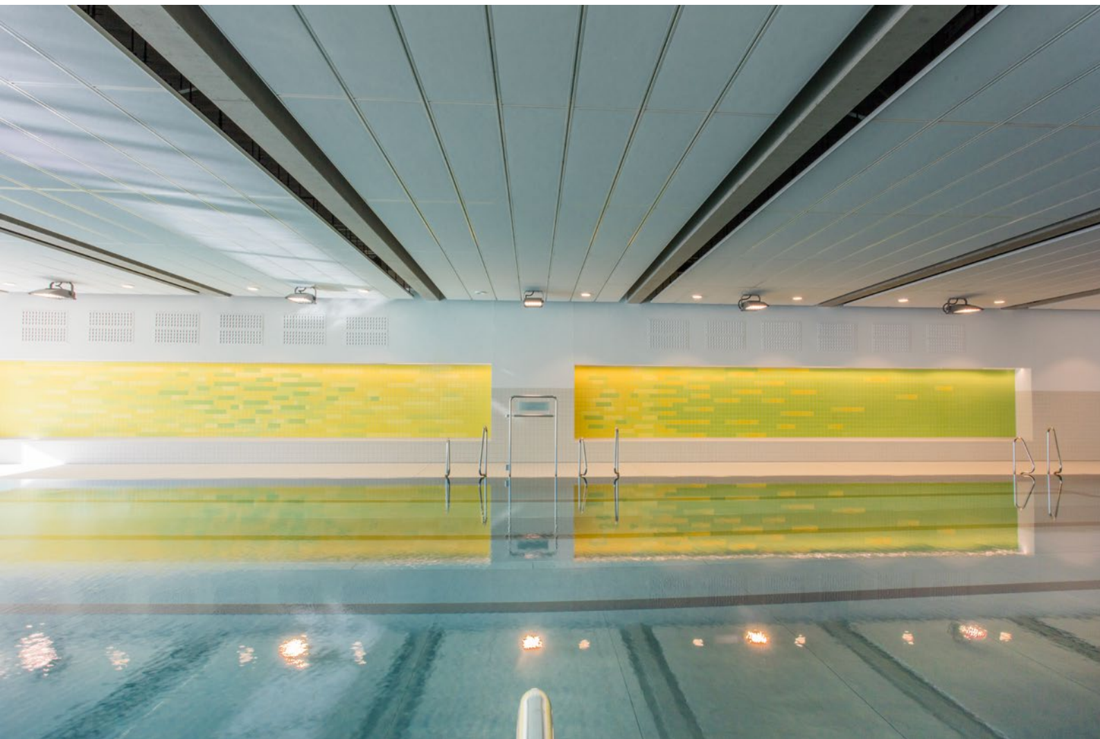
Sportbad Ingolstadt | Sportbad Swimming Pool Ingolstadt | Piscine à Ingolstadt (Allemagne)